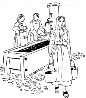
Noch vor zwei Jahren hatten die hundert Bewohner des abgelegenen Dorfes für sich und ihr Vieh in Trockenzeiten bloss zwei Liter Wasser pro Minute zur Verfügung. Bei einem Brandausbruch wäre keine Rettung möglich gewesen. Es ist weitgehend der Schweizer Berghilfe zu verdanken, wenn nun eine gute Wasserversorgung mit vier Dorfbrunnen und sieben Hydranten verwirklicht werden konnte. Der Dank der Bewohner aber gilt ihnen, weil sie so treu zur Schweizer Berghilfe stehen

In Haushaltsschulen lernen die jungen Bauernmädchen kochen, flicken, waschen, bügeln. In Braut ist eine Musterhaushaltsschule, aber keine Musterschule wie wir sie kennen, mit grossen kleinen Räumen, Neonbeleuchtung, Kühlschrank, elektri-