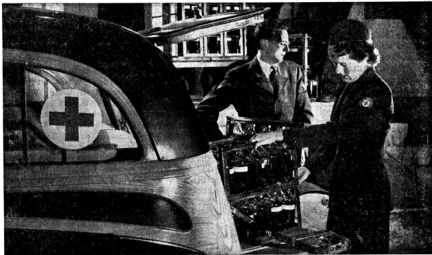
Wöchentlich dreimal fährt die Equipe des Schweizerischen Roten Kreuzes irgendwohin, um Grossblutentnahmen für die Trockenplasma-Fabrikation vorzunehmen. Diese Blutentnahmen werden von den verschiedenen Spendezentren, meistens in Zusammenarbeit mit den lokalen Samaritertvereinen, vorbereitet und umfassen in der Regel 200 bis 300 Entnahmen auf einmal.

Ausserdem beabsichtigt das Schweizerische Rote Kreuz, der Aerzteschaft, noch im Laufe dieses Jahres