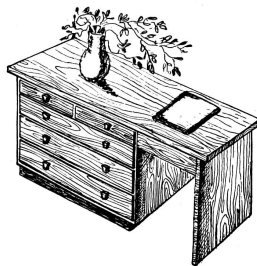
So umgebaut sieht die alte Kommode geradezu modern aus

Wie wäre es, wenn wir diese alte Kommode in einen Schreibtisch umbauen würden? In den Schubladen liesse sich so viel Kleinzug, wie Hefte, Zeichengerätschaften, Handarbeiten und vieles andere versorgen, was sonst irgendwo auf Gesimsen oder