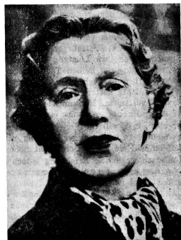
Frau Josephine McNeil

die Gesandtin Irlands in der Schweiz, wurde im Bundeshaus zur Ueberreichung des Beglaubigungsschreibens empfangen