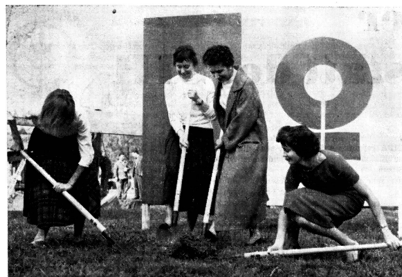
«Hier haben wir die Saffa 1958, die zweite Ausstellung 'Die Schweizer Frau, ihr Leben, ihre Arbeit', sprachen in ihrer Muttersprache beim ersten Spatenstich auf dem Ausstellungsgelände am 17. Oktober die junge Welsche, die Tessinerin, die Vertreterin Romanisch-Bündens und die Deutschschweizerin.