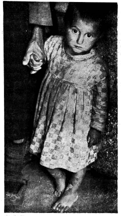
Gross ist das Heer der Kinder, welche die unschuldigen Opfer von Weltpolitik und einseitiger wirtschaftlicher Begünstigung sind. Ihre Augen fragen, ob wir etwas für sie tun können.

E.P.D. Es ist kaum bekannt, dass dieser Staatsmann, Dr. Tubmann, ein lebendiges Glied der Methodisten-Gemeinde ist. Sein Vater war Methodistenprediger und hatte sehr Wert darauf gelegt, dass sein Sohn eine gute Ausbildung erhalte. Dieser studierte Rechtswissenschaften und war, ehe er Präsident wurde, Richter beim Oberlandesgericht. Daneben betätigte er sich auch als gern gehörter Laienprediger, so dass er 1928 als Laiendelegierter an die Generalkonferenz der Methodistenkirche nach Kansas City gesandt wurde. Auch heute noch nimmt er lebendigen Anteil am kirchlichen Leben. So hatte er anlässlich seines kürzlichen Aufenthaltes in Hamburg den Gottesdienst seiner Kirche besucht und dabei ein ergreifendes Kredo seines Herzens abgelegt und betont, dass nur von Christus her die Versöhnung der Welt komme.