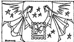
PRO JUVENTUTE-MARKEN sind WEIHNACHTSMARKEN; sie helfen bedürftigen Kindern und freuen den Empfänger!