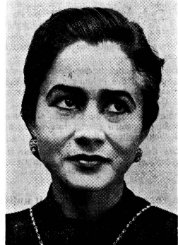
Der erste weibliche Generalkonsul in der Schweiz