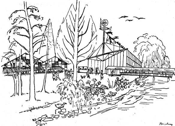
Gaststätten an der Saffa