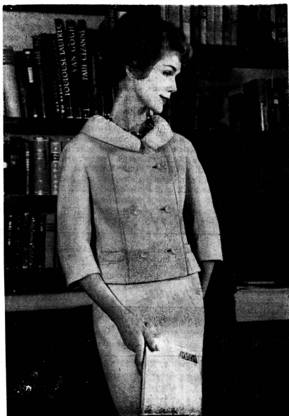
Sommerliches Deux-pièces aus Leinen mit Cardin-Kragen Kollektion O. J. Gassmann Klicsche IAT

Aus dem soeben im Verlag Dietschi, Olten, erschienenen Gedichtband «Grosser Landregen».