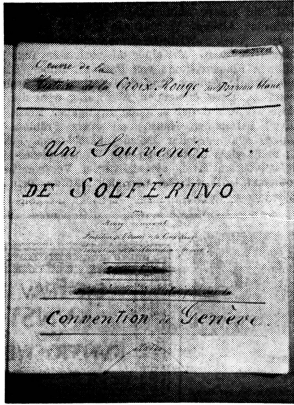
Titelseite von Dunants handgeschriebenem Werk «Un Souvenir de Solferino», 1861

Der bloss zwei Monate dauernde Feldzug vermochte 400 000 Bewaffnete zu mobilisieren und ko-