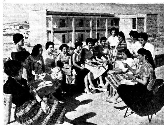
Die Studentinnen des Seminars von Nablus auf Besuch in Ramallah