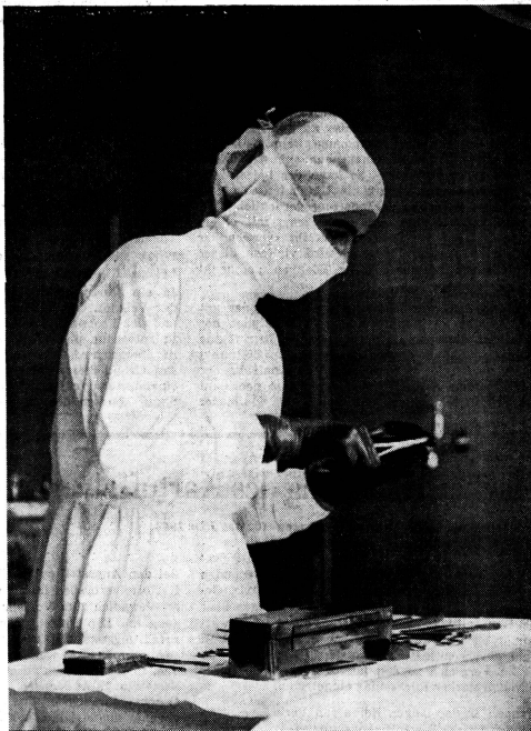
Was geschähe ohne diese Frauenarbeit?