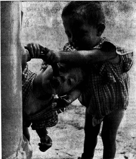
300 bis 500 Liter Wasser brauchen wir heute pro Kopf und Tag. Wir müssen den kommenden Generationen das köstlichste Gut menschlicher Zivilisation erhalten.