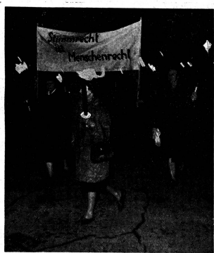
Vom Fackelzug der Zürcherinnen