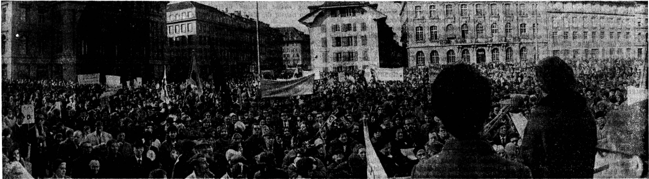
Blick von der Tribüne auf den Bundesplatz, während die Resolution in italienischer Sprache verlesen wird. Sind es «Tausende» (ein Radiosprecher), oder 5000 (so das Fernsehen) oder 3000 (nach einigen Zeitungen), die hier versammelt sind?