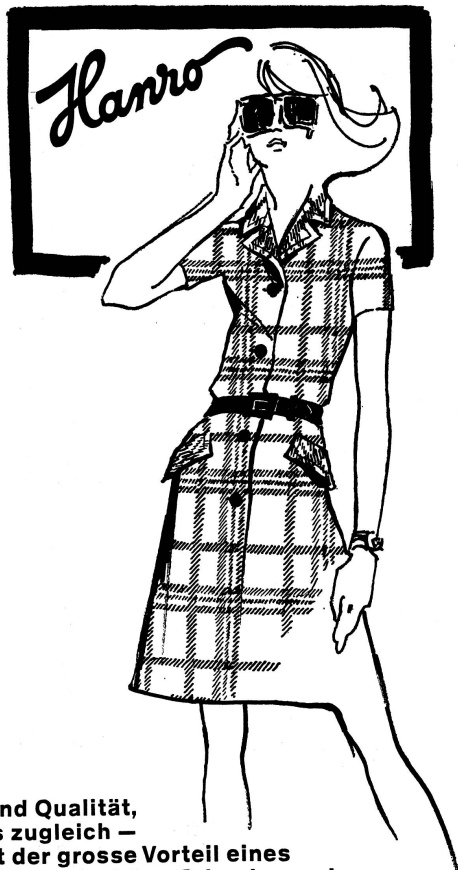
Chic und Qualität, beides zugleich – das ist der grosse Vorteil eines Hanro-Modelles! Aus Crimplene oder Polyester/Baumwolle, waschbar und bügelfrei