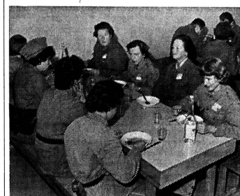
Besonders an uns Frauen geht der Appell, sich für die vielfältigen Aufgaben des Zivilschutzes voll und ganz einzusetzen. In den einzelnen Dienstzweigen der Zivilschutzorganisationen lenkt nicht bloss das Verhalten in einem Katastrophenfall – sie kann das Gelernte gerade im Alltag verwenden.

Dauer der Ausbildung – ein äusserst aufschlussreicher und nicht zu überschender Punkt. In der Hauswehr erfolgt die Ausbildung am Wohnort in Halbtages- oder Tageskursen. Neu eingeteilte Angehörige der örtlichen Schutzorganisationen und des Betriebsschutzes absolvieren einen Einführungskurs bis zu drei Tagen. Vorgesetzte und Spezialisten der Schutzorganisationen erhalten in