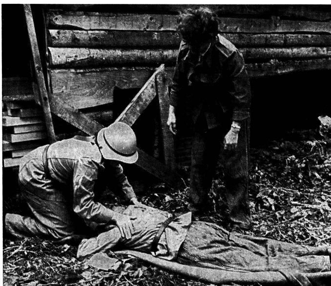
Zivilschutz ist Sache aller. Nur ein gut funktionierender Zivilschutz gibt uns die Möglichkeit, im Katastrophenfall zu überleben. Zivilschutz geht auch in ganz besonderer Masse die Frau an. In zahlreichen Kursen wird sie fachlich und technisch ausgebildet, damit sie im Ernstfall ihren Mann stellen kann.