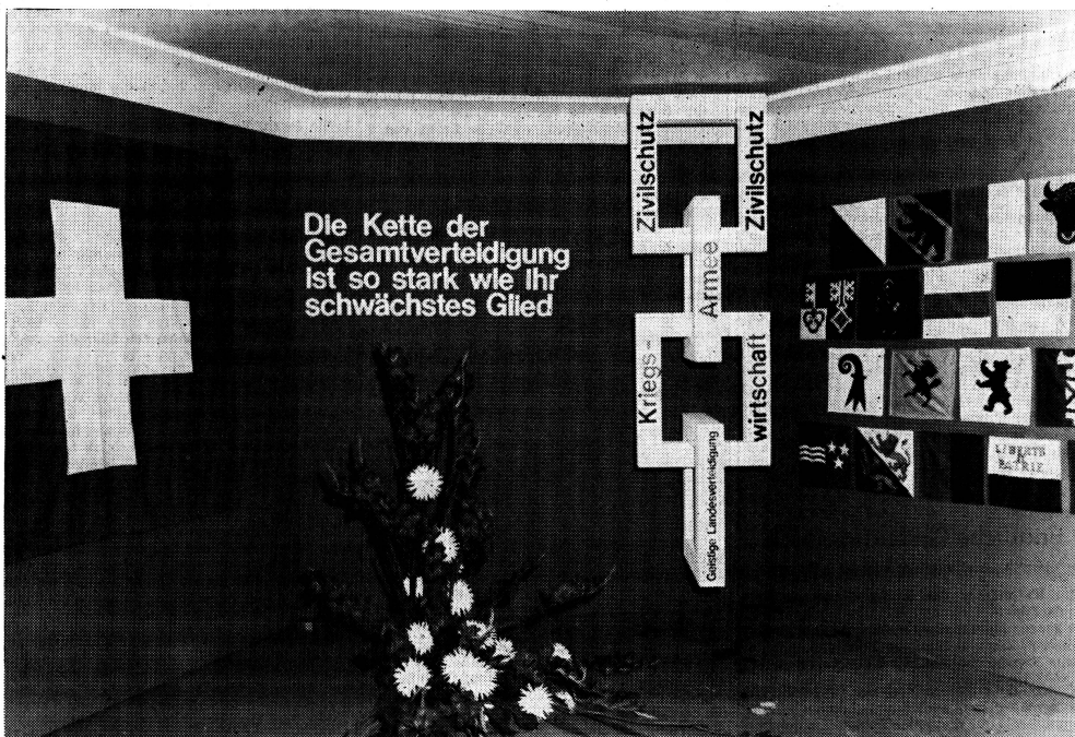
Die Kette der Gesamtverteidigung

In allen Gemeinden, welche diesen auf gesetzlicher Grundlage beruhenden Aufgaben nachgeht und verantwortungsbewusste Behörden ihre Durchführung laufend überprüfen, ist es um den Zivilschutz nicht schlecht bestellt. Im Rahmen der Gesamtverteidigung kommt den Gemeinden vor allem auf dem Gebiete des Zivilschutzes entscheidende Bedeutung zu, wird doch der Kampf um das Dasein und Ueberleben in der kleinsten Gemeinschaft entschieden.