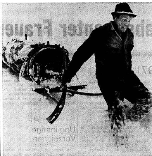
Gross sind die durch das Gelände und die Höhenlage bedingten Schwierigkeiten, mit denen unsere Bergbauern zu kämpfen haben. Umfangreich ist der Katalog unausschiebbarer Projekte, die zwar staatliche Subventionen genießen, deren Restkosten aber häufig das Leistungsvermögen der Betroffenen übersteigen. Es ist deshalb sinnvoll, wenn wir durch unsere Spenden die Schweizer Berghilfe in die Lage versetzen, auch dieses Jahr wieder wertvolle Entwicklungshilfe im eigenen Land zu leisten. Schweizer Berghilfe-Sammlung 1972, Postcheckkonto 80-32443, Zürich.

Ingrid Langer-El Sayed: «Frau und Illustrierte im Kapitalismus». Die Inhaltsstruktur von illustrierten Frauenschriften und ihr Bezug zur gesellschaftlichen Wirklichkeit (Pahl-Rugenstein, Köln).