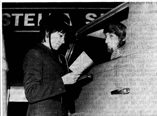
13 Polizei-Hostessen haben am 1. Dezember in Bern ihren Dienst aufgenommen. «Ganz in Rot» sollen sie ihren 40 männlichen Kollegen im Kampf gegen das Verkehrsschlamassel in der Bundesstadt bestehen. In einer viermonatigen Ausbildung sind sie mit den gleichen Kenntnissen ausgestattet worden wie die männlichen Verkehrsbeamten. Doch nicht nur ihre Kenntnisse sind gleich; auch ihre Rechte und Pflichten und, vor allem, ihr Lohn unterscheiden sich nicht von denjenigen der Männer. (P)

Die Wettbewerbsbedingungen können bei der Geschäftsstelle des Heimatwerkes, Rudolf-Brun-Brücke, Postfach, 8023 Zürich, gratis bezogen werden.