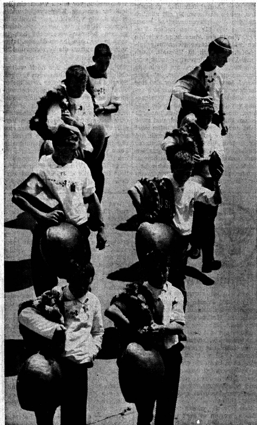
Ein Recht, unseren Nationalfeiertag echt und nicht nur als überlieferte Folklore zu begehen, haben wir nur, wenn es uns gelingt, ihm einen Inhalt zu geben, der nicht nur in der Vergangenheit wurzelt, sondern in die Zukunft weist.