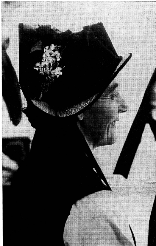
Auf uns Frauen lastet, wenigstens von Rechtes wegen, noch kaum eine Verantwortung für Vergangenes in unserer Demokratie. Wir sind die Neudazugekommenen, die aufgerufen sind, zusammen mit allen, die guten Willens sind, mitzugestalten und mitzuarbeiten an dem, was unsere Heimat in Zukunft bedeuten soll.

Beziehung zum Mitmenschen, innerhalb und ausserhalb unserer Grenzen. Mit der Ueberwertung von Jugend, Kraft und Intelligenz verschliessen wir die Augen vor den drängenden Problemen unserer immer grösser werdenden Gruppe betagter Mitmenschen. Unduldsamkeit gegenüber Andersdenkenden und Andersgearteten machen uns selbstgerecht und überheblich. So schaffen wir alle denkbaren Voraussetzungen dafür, dass wir alles andere als ein einzig Volk von Brüdern sind noch es werden. Brauchen wir es überhaupt noch, dieses einzige Volk? Ist es überhaupt heute noch möglich, innerhalb von Landesgrenzen so etwas wie eine Zielsetzung für menschliches Verhalten und Zusammenleben zu begründen oder zu verwirklichen? Und schliesslich, sind ausgerechnet wir Frauen dazu aufgerufen, hier Neues, Positives zu leisten?