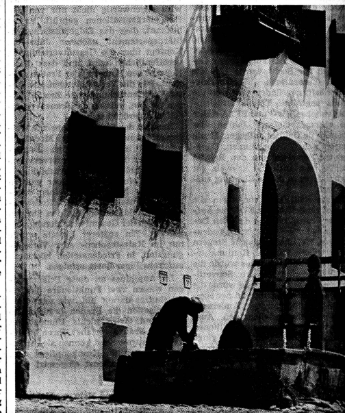
Wäscherin am Brunnen von Guarda, Engadin.

Gerade die Frauen haben also alle Grund, sich die Frage vorzulegen, ob es angesichts der heute erreichten Versicherungsdichte von 90 Prozent und angesichts der Kompliziertheit des freiwilligen Sektors mit all seinen Unzulänglichkeiten nicht an der Zeit wäre, endlich mutig den grossen Schritt vom unübersehbaren Wirrwarr kantonalen und kommunaler Obligationen weg zu wagen und — wie das übrige Europa — zu einer umfassenden Solidarität zu gelangen. Diese Solidarität brauchte keinesfalls «den Schnupfen» zu decken; auch darüber, ob die Finanzierung voll lohnprozentual oder — wie das Konkordat der Krankenkassen es vorschlägt — gemischt erfolgen soll, liesse sich diskutieren. Dr. Sylvia Arnold