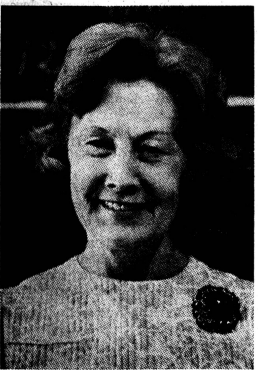
H. Hon. Barbara Castle, London

Eine Tagung über Partnerschaft: Kein einziges Behördenmitglied fand das interessant genug, um anwesend zu sein. — «Das ist doch Frauenache» sagten sich — mit acht Ausnahmen — mehrere tausend eingeladene Manager und blieben der Tagung fern. — Die Zeitungen beileisten sich, einen weiblichen Berichterstatter zu delegieren. — So sassen denn rund 120 Frauen und 40 Männer im gastfreundlichen «Park im Grünen», was wieder einmal beides Zeugnis von der Ueberheblichkeit mancher Männer ablegte, welche Partnerschaftsfragen als «Weiberkram» abzutun pflegten.