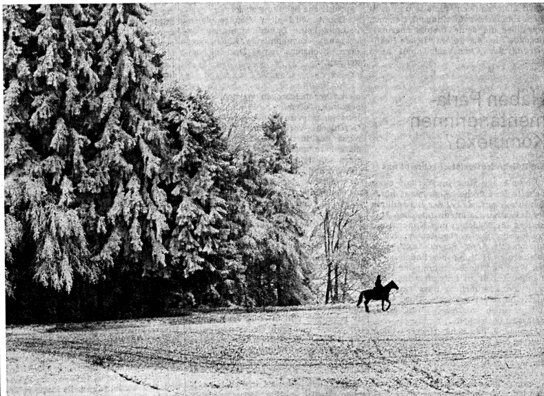
Allein auf weiter Flur ist unser «SFB». Dass die Frage unserer Radiosendung «Brauchen die Frauen eine eigene Zeitung?» gestrot mit Ja beantwortet werden kann, geht aus dem riesigen Echo hervor. Das Bedürfnis dafür ist eindeutig da. Deshalb bitten wir unsere Leserinnen wieder einmal um Schützenhilfe: Helfen Sie uns, das «SFB» bekannt zu machen!