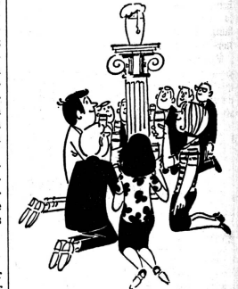
Diese Vignette ist entnommen dem Bändchen Nr. 2 der Reihe Helfen und Heilen: «Alkoholismus - Hilfe ist möglich.»

Fachliteratur muss nicht langweilig sein! Nr. 1 und 2 der Reihe Helfen und Heilen, gemeinsam herausgegeben vom Blaukreuzverlag für die deutsche Schweiz und Westdeutschland, sind verständlich für jedermann. In Nr. 1 «Vom Hintergrund der Süchte» geht