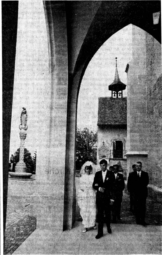
Hochzeitskutschen, Glockengeläut, Brautschleier... wie viele Wunschträume weckt diese Vorstellung bei den meisten unverheirateten Frauen! Ist es verwunderlich, dass sich mit der Hoffnung, der Einsamkeit entziehen zu können, gute Geschäfte machen lassen?

Eine Heiratsvermittlerin, die seit vielen Jahren in dieser Branche tätig ist, schrieb mir: «Die Eheanbahnung sollte nicht nur vom Standpunkt der finanziellen Ausbeutung aus gesehen werden, obwohl diese ja schlimme Ausschreitungen zeitigt. Zu Bedenken