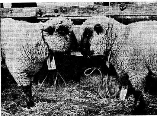
Vertrauliches «Gespräch unter vier Augen»

Am Anfang galt es, im damaligen Palästina um das Jahr 1920 die Milchverteilungsstellen in Jerusalem und anderen Ortschaften für Säuglinge