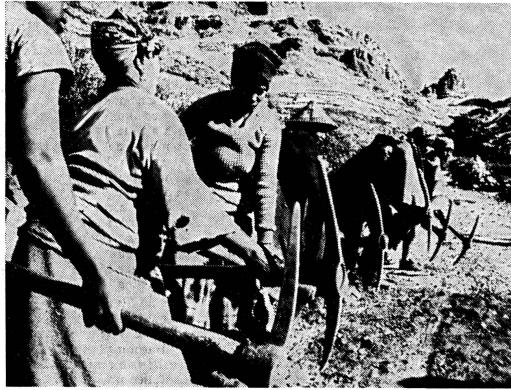
Selbsthilfe ist das Stichwort, mit dem die Welt Ernährungsorganisation (FAO) die Bevölkerung von Lesotho, in Südafrika, zur Verbesserung ihrer Lebensbedingungen bringen möchte. Weil die Männer in den Minen arbeiten, werden die Entwicklungsarbeiten hauptsächlich von Frauen geleistet. Sie schrecken selbst vor dem Strassenbau nicht zurück. Das Bild zeigt Lesotho-Frauen bei der Arbeit an der Sani-Passstrasse, die Lesotho mit Südafrika über eine Höhe von 3000 Metern verbindet.

Seit dem Ersten Weltkrieg sind internationale Frauenorganisationen wie Pilze aus dem Boden geschossen. Der ICW unterstützte die Spezialisierung und gründete selbst den Weltfrauenverband (Associated Countrywomen of the World), setzte sich aber ein für eine enge Zusammenarbeit und gemeinsame Aktionen, unter anderem für das Bürgerrecht der verheirateten