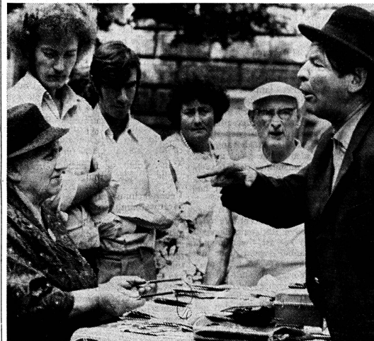
Lassen Frauen sich leichter von Wundermitteln überzeugen als Männer?