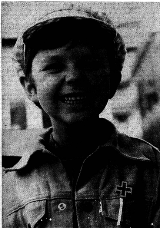
Tausende von Kindern haben auch an diesem 1. August mit Stolz und Freude ihr Abzeichen getragen. Aber wissen sie wirklich, was dieser Tag bedeutet, oder ist es einfach der zusätzliche Sonntag während der Ferien, an dem es etwas Besseres zu essen und abends Feuerwerk gibt? Zu den Aufgaben der Eltern – vor allem auch der Mutter – gehört auch der erste staatsbürgerliche Unterricht. Wenn wir nicht imstande sind, den Kindern zu zeigen, worauf sie stolz sein dürfen, wofür sie dankbar sein sollen als Schweizer und wo unsere Schwierigkeiten liegen, brauchen wir uns nicht zu wundern, wenn nachher kein Grund vorhanden ist, in dem ein Gefühl der Zugehörigkeit und der Verantwortung für dieses Land wurzeln kann.