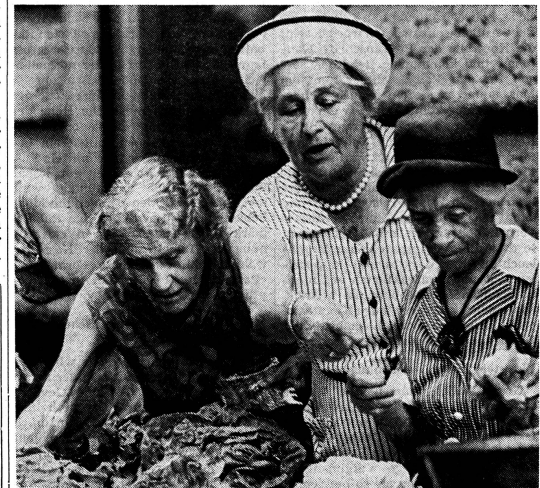
Drei qualitätsbewusste Käuferinnen