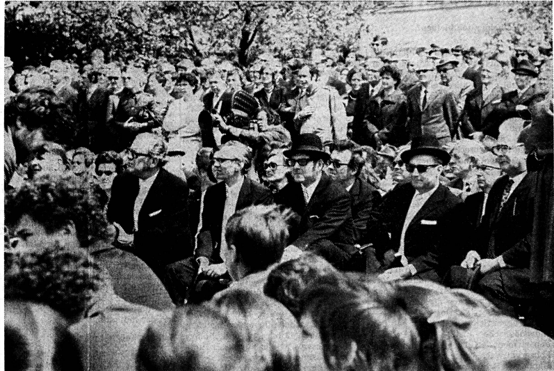
Der Anblick von Frauen im Landsgemeindinger ist noch etwas ungewohnt. Aber Frauen, die politisch mitarbeiten wollen an der Gestaltung dieses Landes, müssen sich vor allem orientieren. Und den besten Anschauungsunterricht leibendiger Demokratie vermitteln sicher Gemeindeversammlungen und Landsgemeinden.

Türen stehen ihnen offen – wenigstens theoretisch. Denn noch immer ist festzustellen, dass die Frauen hinsichtlich der Berufswahl viel grösseren Schwierigkeiten gegenüberstehen als die Männer. Noch lange werden sie sich gegen das Hemmnis bestehender Ideen, gegen alte Tabus auflehnen müssen. Auch wenn es einfach ist, in einem Land mit starkem Mangel an Arbeitskräften eine untergeordnete Stelle zu finden, so stellen sich doch noch immer viele Hindernisse in den Weg einer Karriere nach freier Wahl, der einzigen Art von Karriere, die eine freie Entwicklung der Persönlichkeit erlaubt. Ein klares Erfassen unseres Standorts und das aktive Mitmachen in der Politik werden uns dieses Handicap überwinden helfen. Das Stimm- und Wahlrecht ist die Grund-