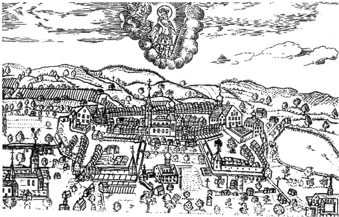
Abb. 2: Alter Stich von Wil