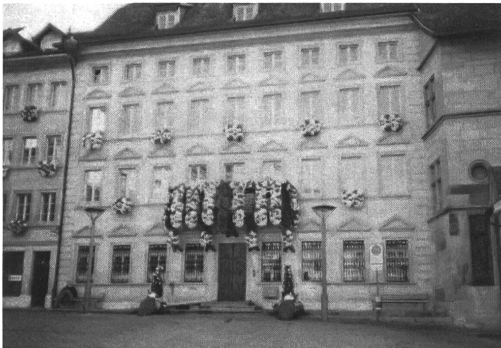
Das Stadthaus – links neben dem Rathaus

Der Rundgang begann sogleich bei einem bedeutenden Bauwerk, dem Rathaus, das von 1501 bis 1522 an der Stelle der ehemaligen, im 15. Jahrhundert zerstörten Zähringer Burg erbaut wurde. Unsere Aufmerksamkeit fand auch das nebenan stehende Stadthaus von 1731, das sich mit einer Stilmischung aus Barock und Klassizismus präsentiert. Blickfang bildeten die von einem Balkon herunterhängenden prächtigen Blumengirlanden. Eine besondere Legende rankt sich um die Murten-Linde, die einst auf der gegenüberliegenden Seite stand. Gemäss Überlieferung schwenkte der Bote, der 1476 in Fribourg die Siegesnachricht über Karl den Kühnen überbringen sollte, auf dem Weg einen Ast, den er von einer Linde auf dem Schlachtfeld abgebrochen hatte.