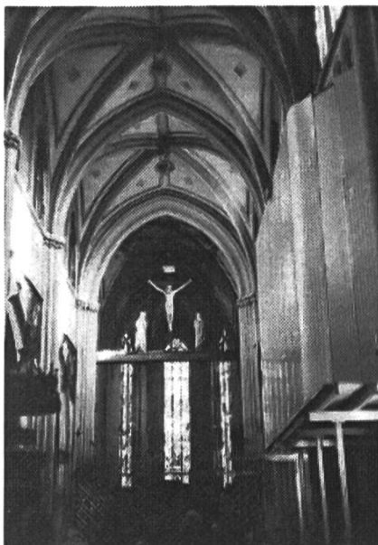
Blick zum Chor der Kathedrale

Als bald fanden wir uns ein in der Kathedrale St. Nikolaus, die als besonderes Bauwerk weit über Fribourg sichtbar ist. Ihr Portal ist mit einem Relief aus dem 14. Jahrhundert geschmückt, welches das Jüngste Gericht mit Hölle und Paradies darstellt, während die Fassade mit zwölf Apostelstatuen geschmückt ist. Wir nahmen Platz im polygonalen Chor und betrachteten das grosse, moderne Kreuz über dem Hauptaltar, dessen nach oben gerichtete Arme die Auferstehung symbolisieren sollen. Beeindruckt haben die vom polnischen Maler Józef Mehoffer (1869 – 1946) zwischen 1896 und 1936 geschaffenen Kirchenfenster im Jugendstil, die 1970 durch den französischen Künstler