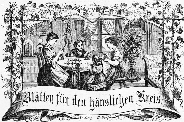
Motto: Immer strebe zum Ganzen; — und launet Du selber kein Ganzes werden. Als eines Tages Glücklich an ein Ganzes Dich an.