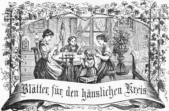
Motto: Immer strebe zum Ganzen; — und kannst Du selber kein Ganzes werden, Als dienendes Glied schlies' an ein Ganzes Dich an.