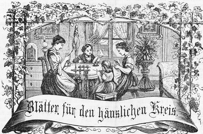
Motto: Immer strebe zum Ganzen; — und damit Du selber kein Ganzes werden. Als dienendes Glied schlies' an ein Ganzes Dich an.