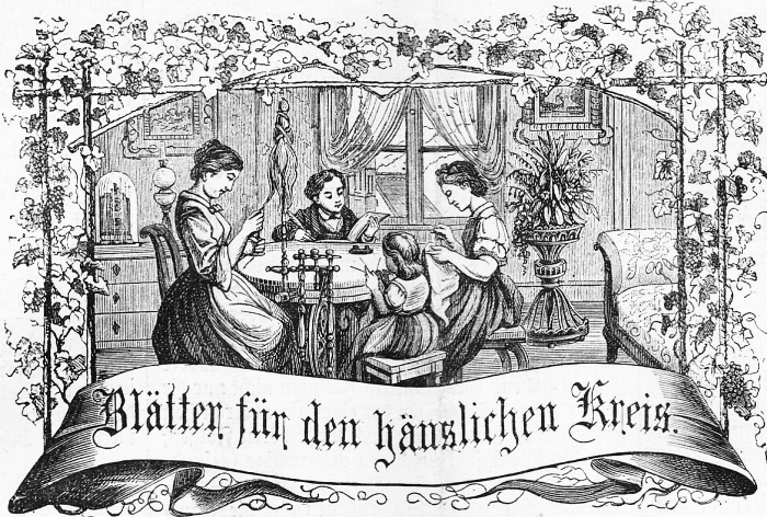
Notto: Immer frohe zum Ganzen; — und kannis Du selber kein Ganzes werden. Als dieneses Glied schliesse dem Ganzen Dich an.