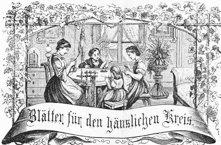
Motto: Immer strebe zum Ganzen; — und kamst Du selber kein Ganzes werden, Als dienendes Glied schliesse dem Ganzen Dich an.