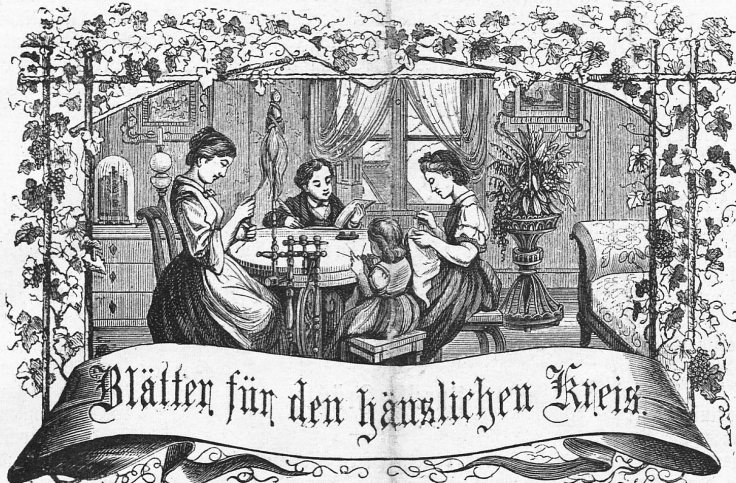
Motto: Immer strebe zum Ganzen; — und kannst Du selber kein Ganzes werden, Als dienendes Glied schliesse dem Ganzen Dich an.