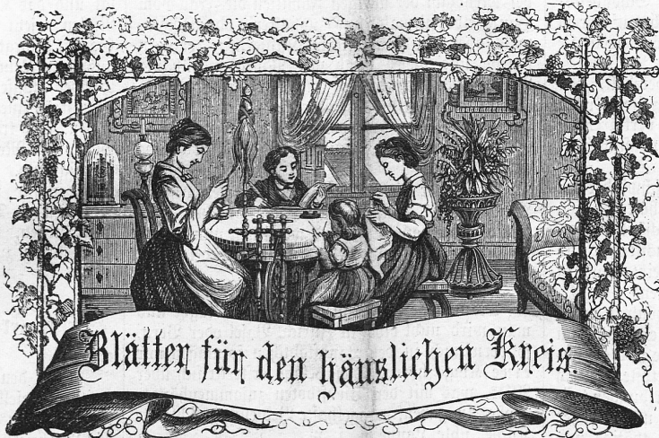
Motto: Immer strebe zum Ganzen; — und laß dich von selber kein Ganzes werden, Als dienendes Glied schließe dem Ganzen Dich an.