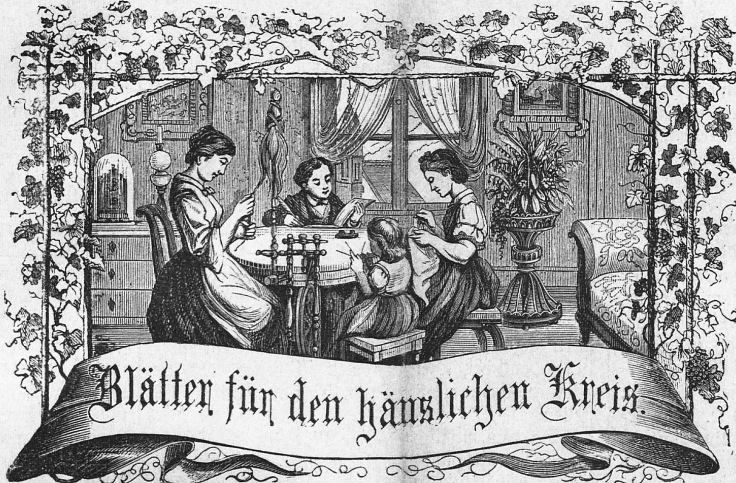
Motto: Immer strebe zum Ganzen; — und laßst Du selber kein Ganzes werden. Als bienendes Biech schließe dem Ganzen Dich an.