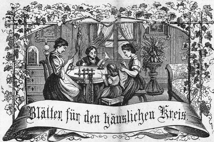
Motto: Immer freie zum Gange; — und kannst Du selber kein Ganges werden, Als dienendes Glied schliesse dem Gange Dich an.