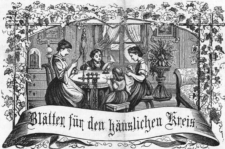
Motto: Immer strebe zum Gange; — und kammt Du selber kein Ganges werden, Als dienendes Glied schließe dem Gange Dich an.