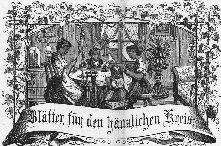
Motto: Immer strebe zum Ganzen; — und kannst Du selber kein Ganzes werden, Als dienendes Glied schliesse dem Ganzen Dich an.

Telephon in der Källin'schen Druckerei. Telegramm-Expresen: 50 Cts.