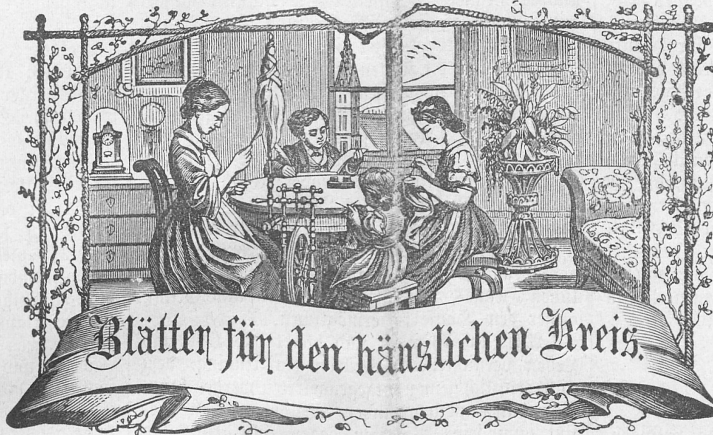
Motto: Immer strebe zum Ganzen; — und laßst Du selber kein Ganzes werden, Als dienendes Glied schliesse den Ganzen Dich an.

Abonnement: Bei Franko-Zustellung per Post: Jährlich . . . . . Fr. 5. 70 Halbjährlich . . . . . 3. — Schnittmuster per Quartal 50 Cts. Ausland: Portozuschlag 5 Cts.