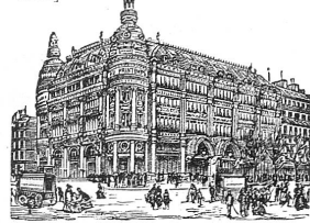
GRANDS MAGASINS DU