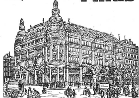
GRANDS MAGASINS DU