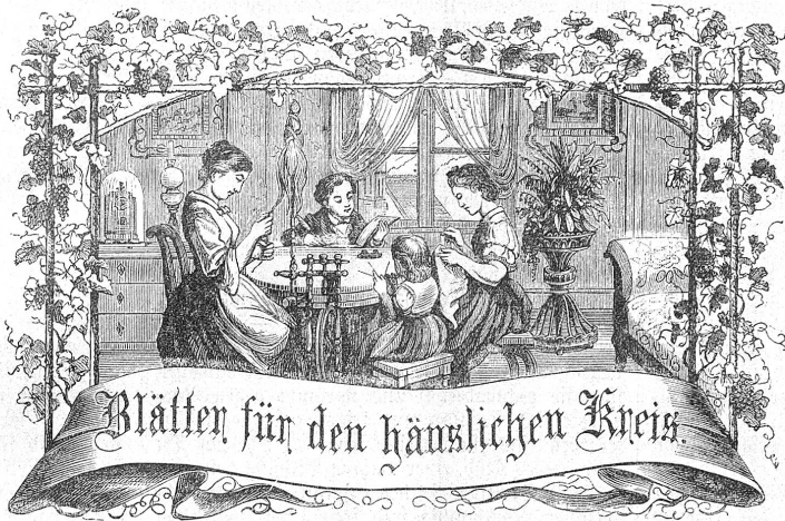
Motto: Immer strebe zum Ganzen; — und laßni Du selber kein Ganzes werden. Als dienendes Glied schließe dem Ganzen Dich an.

Abonnement: Bei Franko-Zustellung per Post: Jährlich . . . . . Fr. 6. — Halbjährlich . . . . . " 3. — Ins Ausland fto. per Jahr " 8. 30