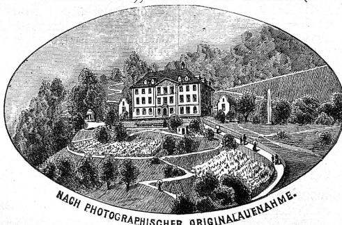
NACH PHOTOGRAPHISCHER ORIGINALAUFNAHME.

in Reutlingen (Württemberg) in Verbindung mit einer Frauenarbeits- und Haushaltungsschule nach dem Landhaus „Haltli“ in Mollis (Kt. Glarus).