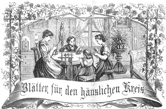
Motto: Immer strebe zum Ganzen, und kannst du selber kein Ganzes werden, als dienendes Glied schliesst an ein Ganzes dich an!

Abonnement: Bei Franco-Zustellung per Post: Jährlich . . . . . Fr. 6. — Halbjährlich . . . . . " 3. — Ausland franco per Jahr " 8. 30