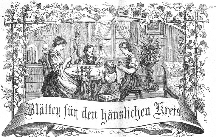
Motto: Immer strebe zum Ganzen, und kannst du selber kein Ganzes werden, als dienendes Glied schliesst an ein Ganzes dich an!

Abonnement: Bei Franko-Zustellung per Post: Jährlich . . . . . Fr. 6. — Halbjährlich . . . . . „ 3. — Ausland franco per Jahr „ 8. 30