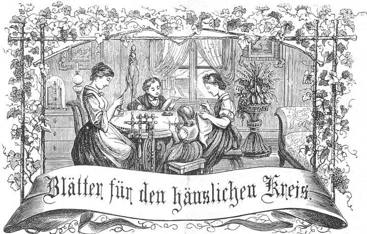
Motto: Immer strebe zum Ganzen, und kamst du selber kein Ganzes werden, als dienendes Glied festlich an ein Ganzes dich an!

Organ für die Interessen der Frauenwelt.