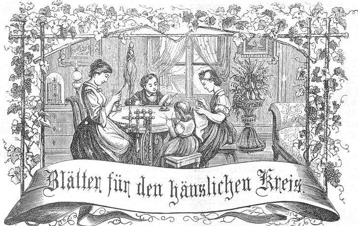
Motto: Immer freie zum Ganzen, und kannst du selber kein Ganzes werden, als dienendes Glied schliesst an ein Ganzes dich an!

Abonnement: Bei Franto-Zustellung per Post: Jährlich . . . . . Fr. 6. — Halbjährlich . . . . . „ 3. — Anstand franto per Jahr „ 8. 30