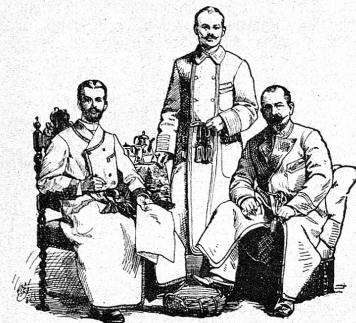
Façon 1. Façon 2. Façon 3.

Dr. Sydney Davonport ist heimgegangen! Sein greiser Vater steht an dem irdischen Grabe, wehmüthig der Zeit gedenkend, wo man auch ihn hinaustragen wird, um ihn zwischen seiner Gattin und seinem Sohne zur ersehnten Ruhe zu betten. Neben ihm steht sein Freund Harley und, auf seinen Arm gestützt, May. Ihr Trauerkleid hebt ihre wunderbare Schönheit noch mehr hervor, und was sie dem Lebenden verlagte hatte, das war in ihrem Herzen — zu spät erwacht: die Liebe und der Schmerz für den Todten! Die Weiden haben ihr Antlitz verklärt, ihre Seele geläutert und ihr Herz jener göttlichen Liebe geöffnet, die ihr der Verstorbenen im Leben an seiner Seite geoffenbart hätte.