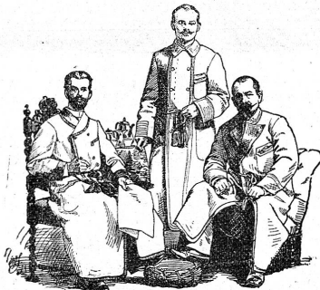
Façon 1. Façon 2. Façon 3.

Um vorgekommenem Missbrauch für die Zukunft vorzubeugen, wird eine verehrliche Kundschaft darauf aufmerksam gemacht, dass jede einzelne Musterkarte meine Firma trägt. (O F 1160) [238]