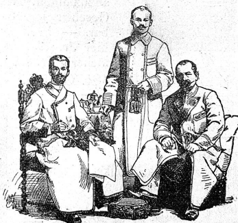
Façon 1. Façon 2. Façon 3.

z. Kameelhof St. Gallen Multergasse 3 Eigene Fabrik: München, Neuhauserstr. 3.