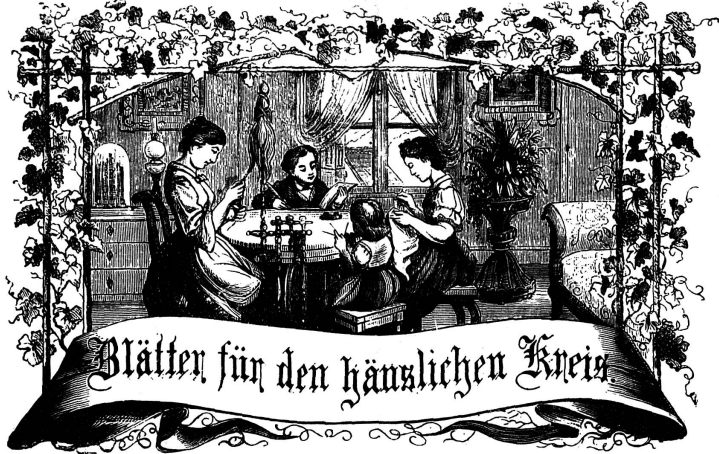
Motto: Immer strebe zum Ganzen, und kannst du selber kein Ganzes werden, als dienendes Glied schlies an ein Ganzes dich an!

Organ für die Interessen der Frauenwelt.