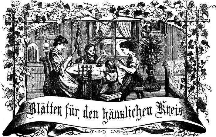
Motto: Immer strebe zum Ganzen, und farnst du selber kein Ganzes werden, als dienendes Glied schliesst an ein Ganzes dich an!

Bureau: Winkelriedstrasse 31 Zelltrappe.