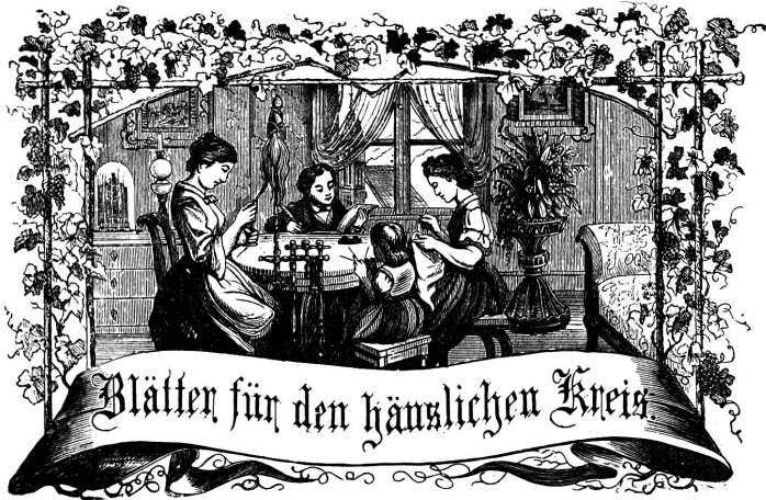
Motto: Immer strebe zum Ganzen, und kommst du selber kein Ganzes werden, als dienendes Glied schliesst an ein Ganzes dich an!