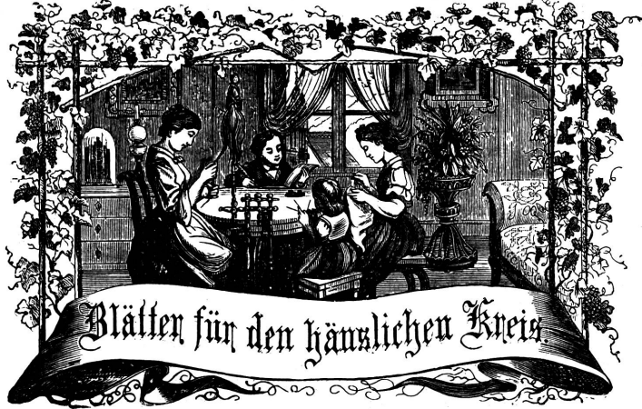
Motto: Immer strebe zum Ganzen, und kannst du selber kein Ganzes werden, als dienendes Glied schliesst an ein Ganzes dich an!